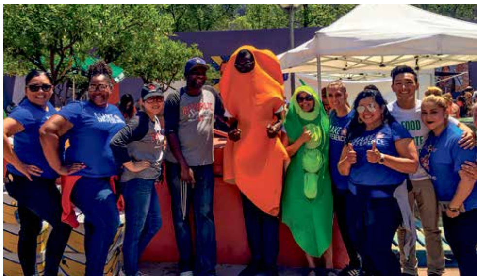
Republic Services Los Angeles employees took part in the Feeding the 5000 event in downtown Los Angeles.

By donating edible food, your business may benefit from improved compliance with AB 1826, the mandatory commercial organics recycling law, tax deductions for charitable giving, and stronger ties with your community. If your business is interested in donating food through this partnership, contact Republic Services at 562-347-4100.