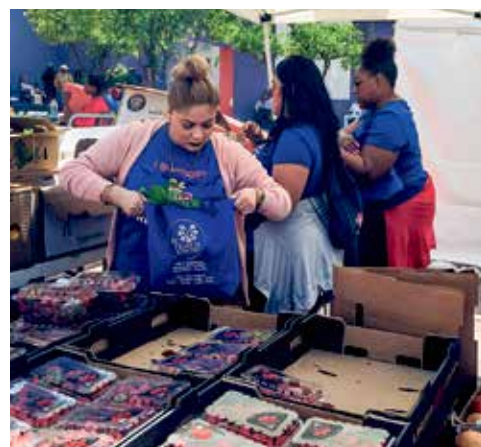
At Feeding the 5000, Republic Services volunteers created meal bags with surplus food from local food banks.

El 4 de mayo, la organización mundial sin fines de lucro Feedback organizó "Feeding the 5000" en el centro de Los Ángeles. Este evento fue diseñado para promover concienciación sobre el impacto ambiental y social del desperdicio de alimentos. Las organizaciones ambientales, las agencias de bancos de alimentos y los empleados de Republic Services trabajaron con los chef locales para cocinar deliciosas comidas servidas con un acompañamiento de información ambiental útil. Miles de personas recibieron una comida gratis elaborada con alimentos que de otro modo se habrían desperdiciado en granjas, comercios minoristas, mayoristas y restaurantes. Los voluntarios de Republic Services también crearon bolsas de comida con excedentes de alimentos proporcionados por los bancos de alimentos locales.