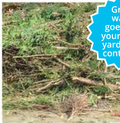
Tree trimmings Recortes de árboles