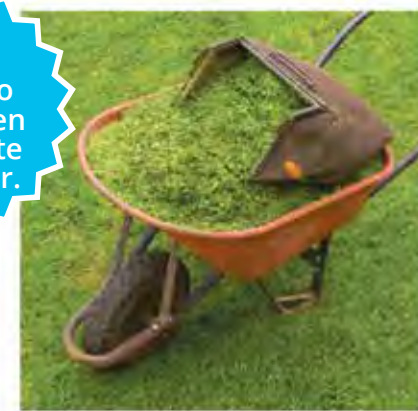
Grass clippings Recortes de césped