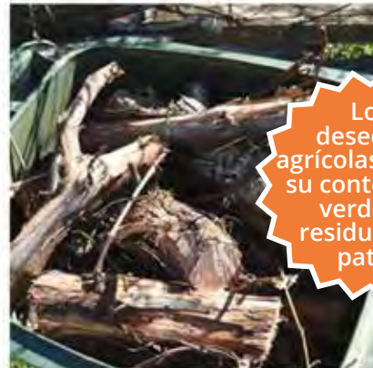
Branches and stumps Ramas y tocones