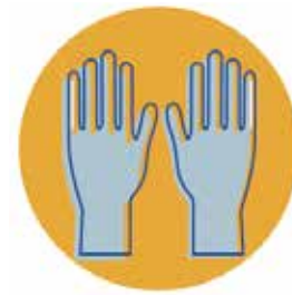
Latex Gloves Guantes de látex