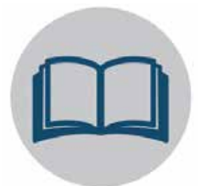
Hard cover books Libros empastados