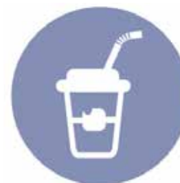
Styrofoam Poliéstireno extrudido